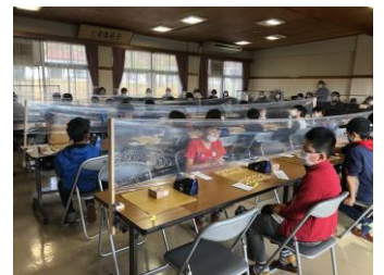
【第 12 回大会 2020 年 11 月】